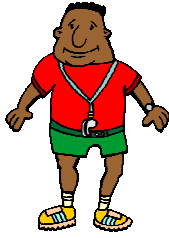
I-għalliem tal-edukazzjoni fiżika

Ċ. Fl-iskola nsibu għalliemha differenti li jgħinuna fil-bżonnijiet tagħna, fosthom: