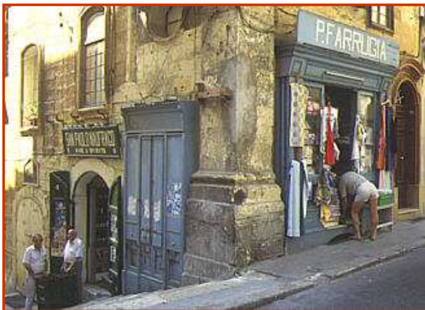
ħanut tal-ħwejjeg antik