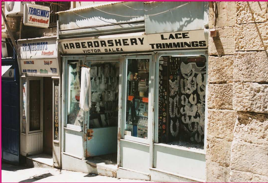
ħanut tal-bżonnijiet tal-ħajjata

Ċ. Flimkien ma' sħabek, oħloq sett ta' mistoqsijiet li tixtieq li tistaqsi lin-nanniet tiegħek dwar il-ħwienet tal-imgħoddi.