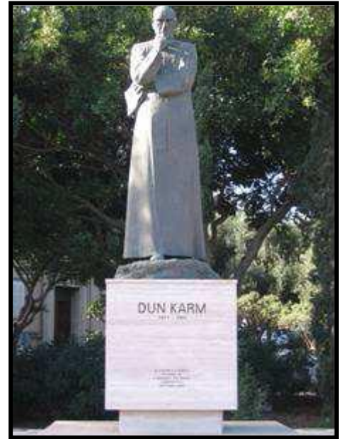
Monument lil Dun Karm Triq Sant' Anna, Furjana

L-ewwel skola ta' Dun Karm kienet l-Iskola Primarja tal-Gvern ta' Haż-Żebbuġ. Għalih dan kien l-isbaħ żmien, tifel mibrum u mimli saħħa. Wara daħal dritt is-Seminarju u minn hemm, ta' 23 sena, ħareġ qassis. Barra li kien qassis, Dun Karm kien għalliem. Kien għalliem dħuli u fuq tiegħu u waqt il-ħin tal-mistrieħ kien iħobb jaqbad il-mandolina u joqgħod idoqqha.