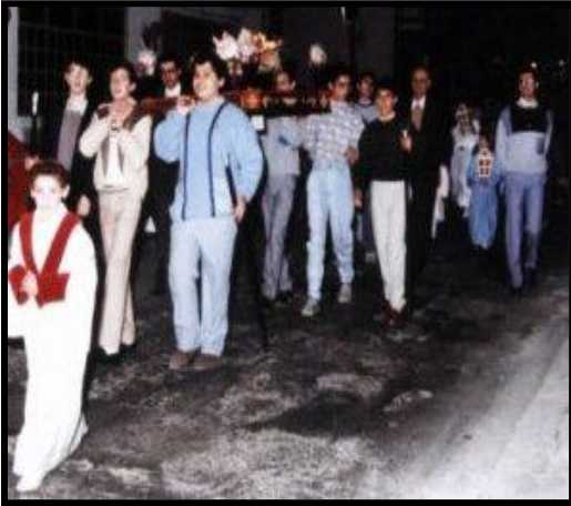
Il-purċissjoni bil-Bambin tal-Milied