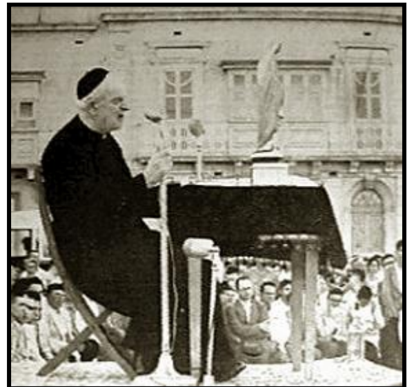
Dun Ġorġ qiegħed jgħallem fil-pubbliku