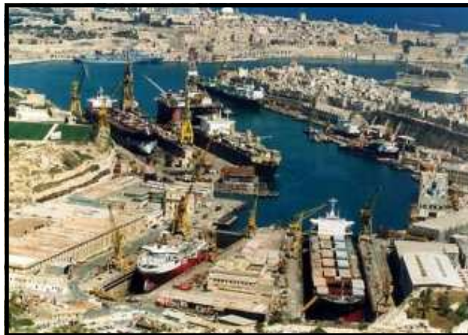
Tarzna - post fejn jissewwew il-vapuri