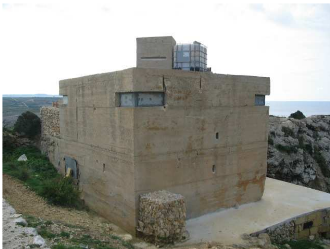
2: IL-PILL BOXES

A: Qabel ir-ritratt mas-sentenza billi tikteb in-numru tar-ritratt fil-kaxxa t-tajba.