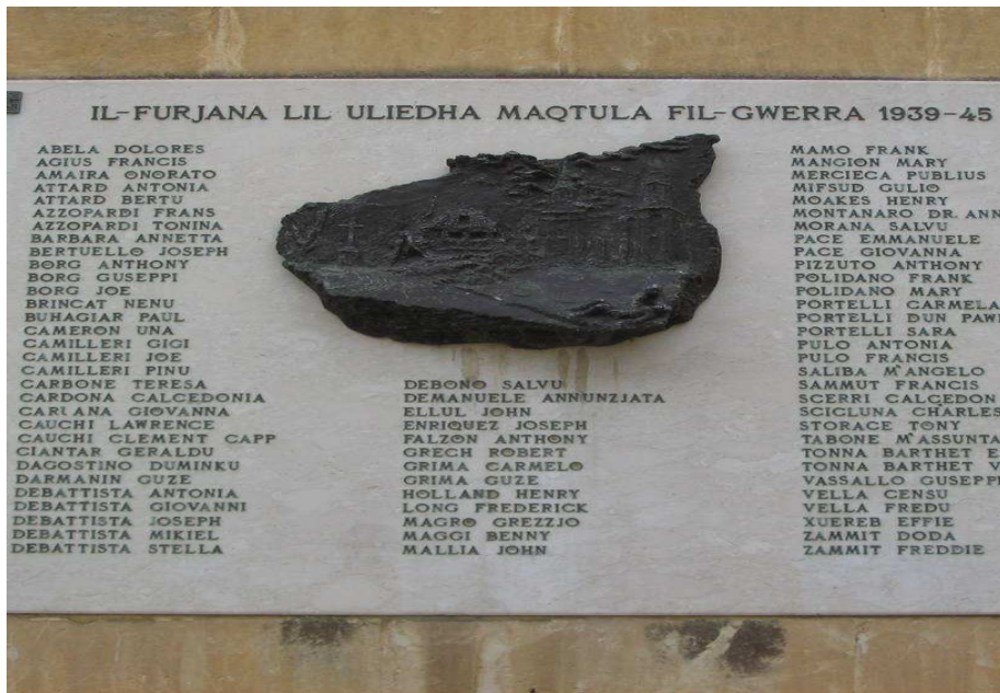
6: LAPIDA LILL-VITTM TAL-GWERRA