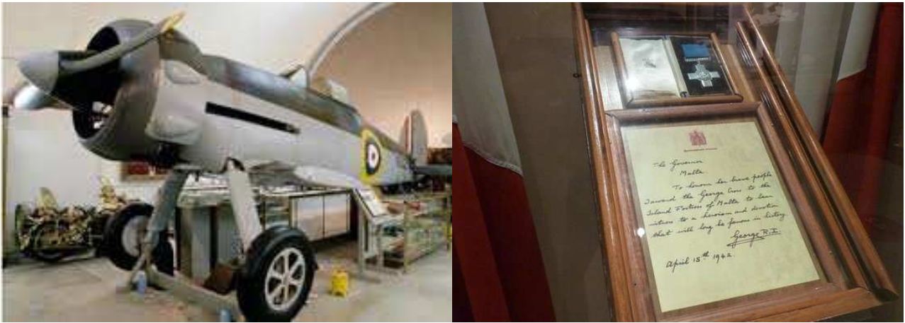
5: IL-MUŻEW TAL-GWERRA