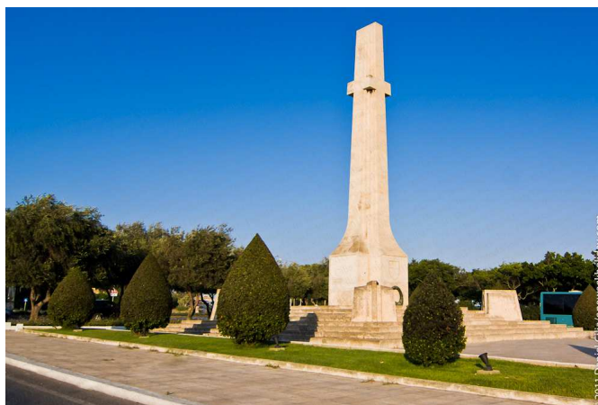
4: IL-MONUMENT TAL-GWERRA