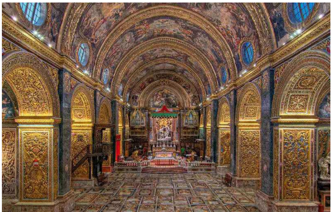
Il-Knisja Konventwali minn ġewwa

Meta kienu serrħu rashom mid-difiża, il-Kavallieri bdew jagħtu dejjem iżjed kas tat-tiżjin tal-bini u kumditajiet ohra. Huma bdew jikkompetu bejniethom dwar min kellu l-ħila jsebbħ il-palazzi tiegħu l-aktar. Inbnew teatru, djar privati, knejjes, funtani u monumenti. In-naħa ta' ġewwa tal-Knisja Konventwali ta' San Ġwann reġgħet ġiet imżejna fuq stil barokk. B'hekk, il-binjiet fil-Belt ħadu xejra aktar imnaqqa u mżejna bi skulturi li ħadu post is-semplicità tal-istil ta' Ġormu Cassar.