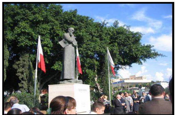
Il-monument lil Dun Karm fi Triq Sant'Anna Il-Furjana