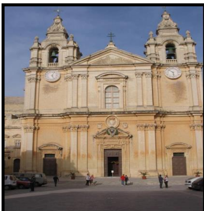
Il-Katidral ta' San Pawl _____