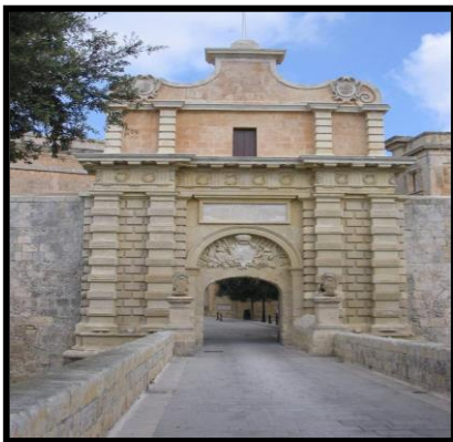
Il-Bieb ta' Mondion _____

Dawn kienu sitt ritratti li ħadu. Ikteb l-isem tal-belt: IL-BIRGU, L-IMDINA jew İĊ-ĊITTADELLA taħt kull ritratt. Kull isem irid jinkiteb darbtejn.