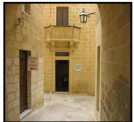
Triq dejqa go Għawdex _____