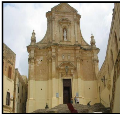
Il-Katidral ta' Santa Marija _____