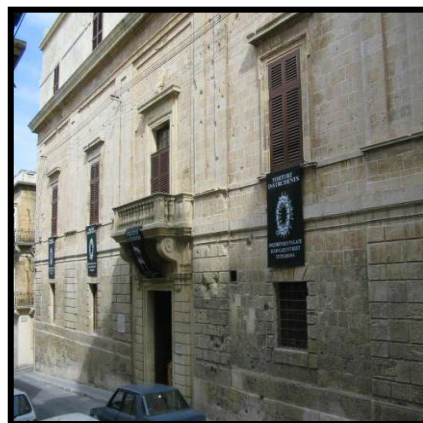
Il-Palazz tal-Inkwizitur _____