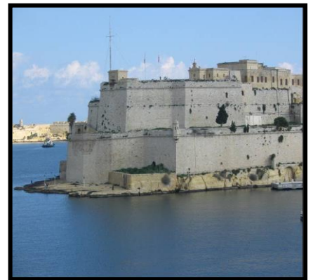
Il-Kastell Sant'Anglu _____